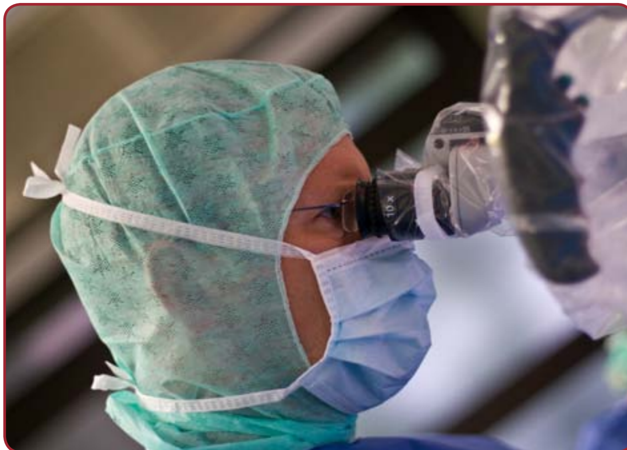
Tabelle B-5.2 Klinik für Orthopädie: Versorgungsschwerpunkte der Organisationseinheit/ Fachabteilung