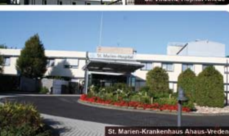
St. Marien-Krankenhaus Ahaus-Vreden Betriebsstätte Vreden