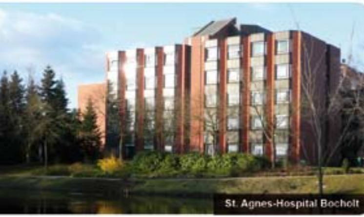
St. Agnes-Hospital Bocholt