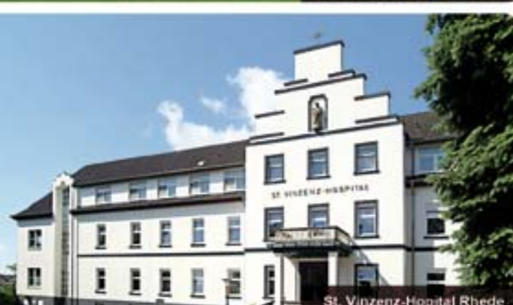
St. Vinzenz-Hospital Rhede