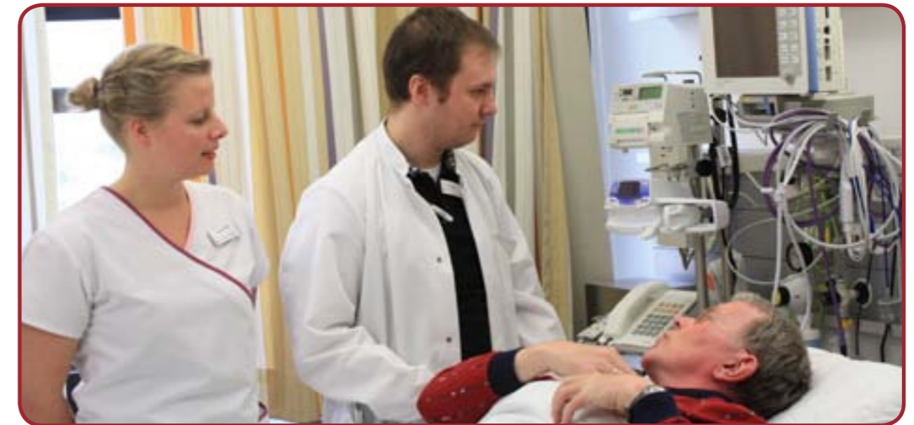
Tabelle B-8.11.1 Klinik für Neurologie, klinische Neurophysiologie mit Stroke Unit: Ärzte