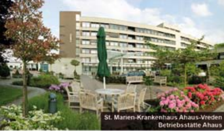
St. Marien-Krankenhaus Ahaus-Vreden Betriebsstätte Ahaus