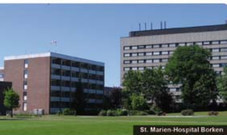
St. Marien-Hospital Borkem